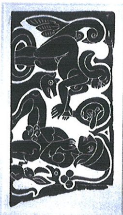
Henry Heerups linoleumsnit "Spejlbilleder" fra 1955 er et af flere nummerede og signerede tryk som galleriet sælger